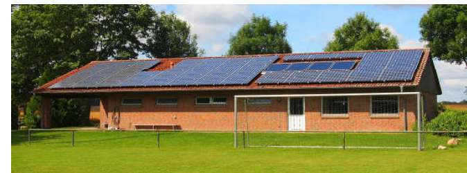
Das Clubheim am Sportplatz