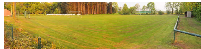
Die beiden Fußballplätze A und B